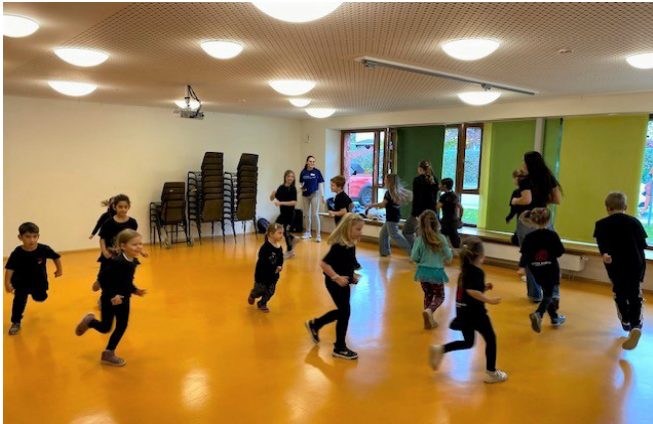
Reges Treiben herrschte am „Tag der offenen Tür“ mit Bewerberinfo in den Kinderhäusern Postwiese und Michelbachstraße. Eltern & Kinder konnten sich von den hellen, freundlichen Räumlichkeiten von Krippen und Kitas überzeugen.