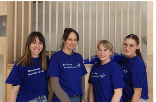
Für Unterhaltung wurde in Form von Ballonkünstlern, Kasperletheater und Tanzaufführungen der Kinder gesorgt. Ein rundum gelungener Tag! Ein Dank an die Erzieher-Teams!