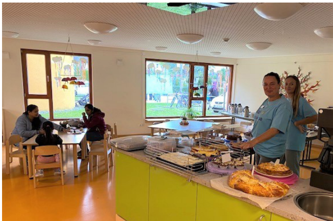
Im Essensbereich des Kinderhauses Postwiese wurde Kaffee & Kuchen angeboten. In lockerer Atmosphäre konnten sich hier Eltern und Erzieher austauschen und informieren.