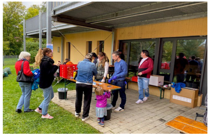
Auf der Terrasse der Kinderkrippe Postwiese wurde der Grill angeworfen. Die milden Temperaturen luden zum Plausch ein. Der Erlös der Bewirtung kommt dem Elternbeirat für künftige Projekte zugunsten der Kinder zugute.