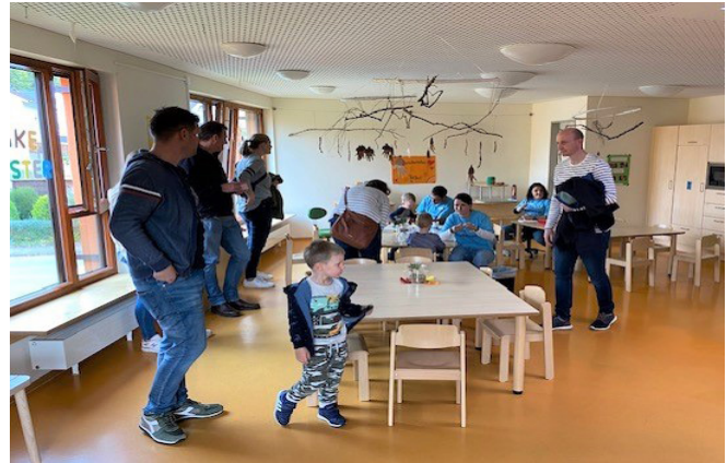
Unter anderem wurden auch die neu eingeführten „VÖ-Light“ Öffnungszeiten in der Kinderkrippe Postwiese vorgestellt. Sie bieten für die Eltern ein noch passgenauerer Betreuungsangebot von 7 bis 12 Uhr.