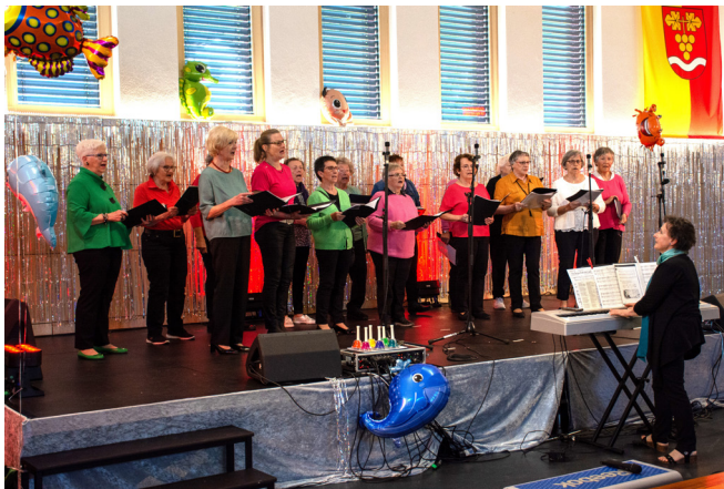
Auch die Landfrauen Affaltrach-Weiler-Eichelberg nutzen das neue Michelbachhaus für Ihre Treffen. Sie unterhielten das Publikum am TdoT mit einem Chor.