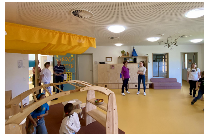
Ein wichtiger Bestandteil des Michelbachhauses ist auch die Kinderbetreuung. Hier konnten sich alle ein Bild der schönen, hellen Räume machen.